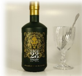
Souvenirflasche mit Glas und Löffel zum Mitnehmen

Eiswasser über den Zucker gießen, Absinth genießen.